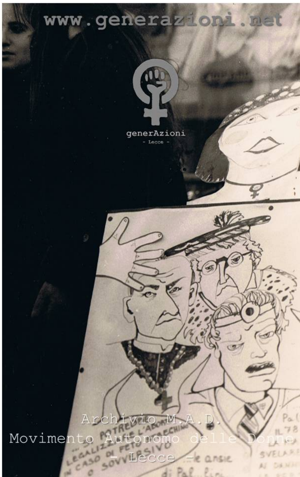
I poster ed il calendario 1978 eliografati